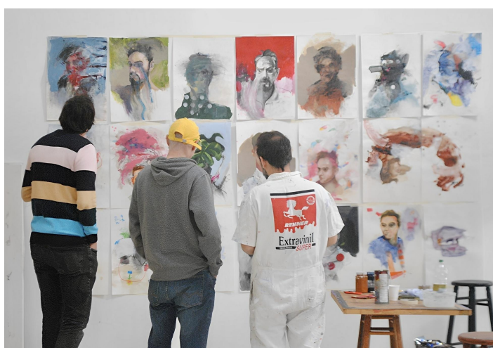
Figura 2 - Ateliê Aberto.